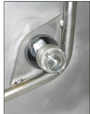
D-Storz Fest- und Blindkupplung