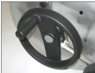
Handkurbel mit einklappbarem Handgriff