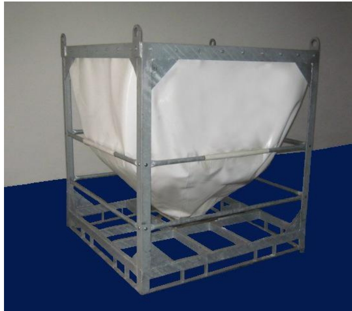
Ausführung mit Kranösen