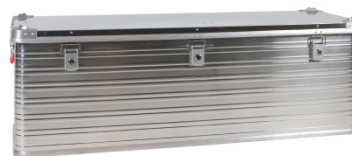
verpackt in Aluminiumbox